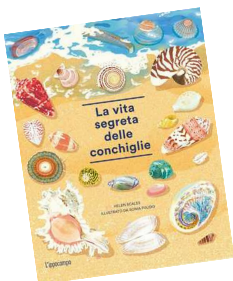
La vita segreta delle conchiglie Helen Scales

Un libro per scoprire tutti i segreti delle conchiglie attraverso l'arte dell'osservare. Da portare al mare come guida o da leggere a casa per viaggiare con la fantasia.