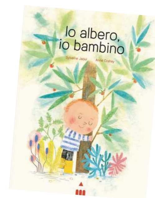
Io albero, io bambino Sylvaine Jaoui

Una lettura esplorativa, complici anche le diverse fustelle disseminate lungo il libro, per indagare il parallelo tra la crescita del germoglio per diventare albero e quella del bambino per diventare uomo.