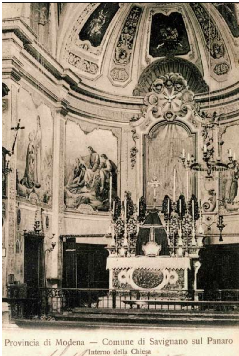
Provincia di Modena — Comune di Savignano sul Panaro Interno della Chiesa

Per un insieme di circostanze non note, non sempre i restauri si sarebbero rivelati adeguati. Dagli interventi in corso che vedono im-